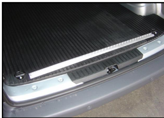
Rail de protection en aluminium situé à l'arrière